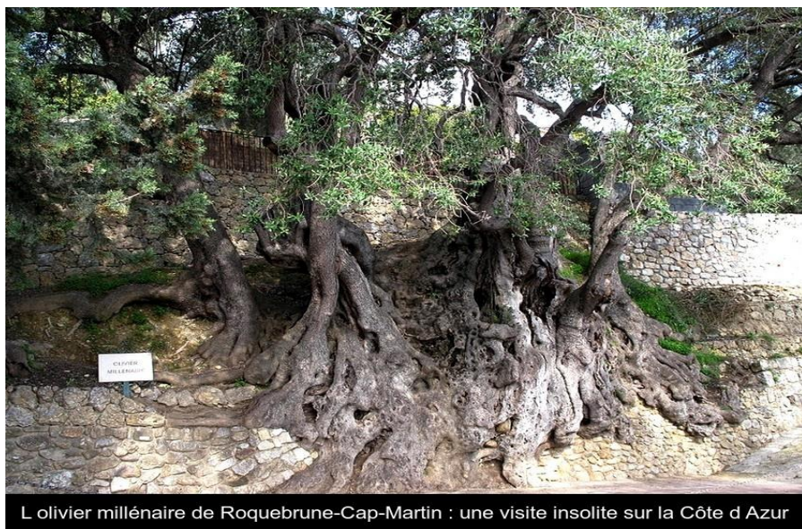
L olivier millénaire de Roquebrune-Cap-Martin : une visite insolite sur la Côte d Azur