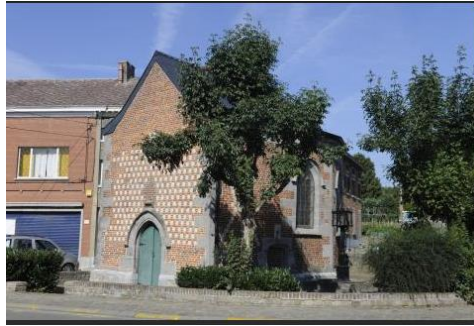
Chapelle Notre-Dame au Puits – Trivières