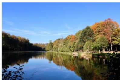
Etang du Bois de la Haye – Le Roeulx