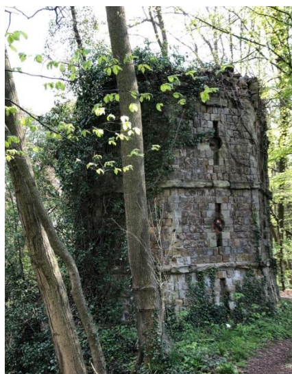
Un vestige du passé