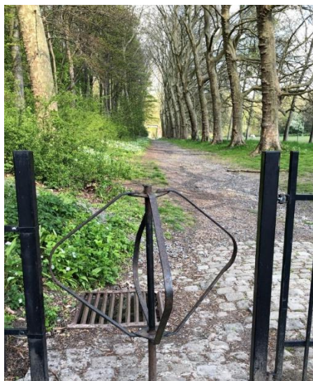
Aux abords du château de la Folle